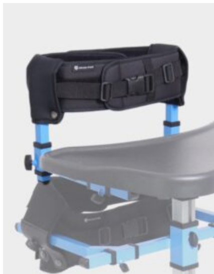
Control de pecho Astride Pro