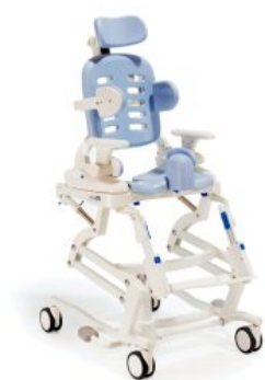
Base Hi-Lo HTS *Required