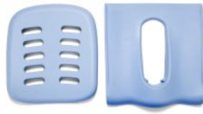
Acolchado asiento y respaldo HTS