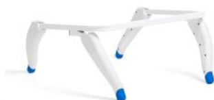
Soporte para ducha y bañera HTS