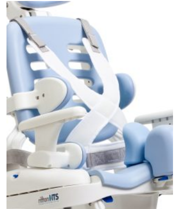
Arnés en forma de mariposa HTS