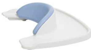
Soporte delantero/bandeja HTS