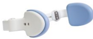
Soportes laterales abatibles HTS