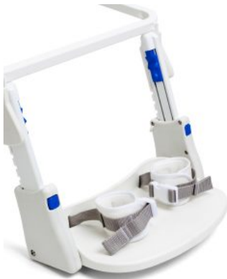
Reposapiés para barra de montaje HTS