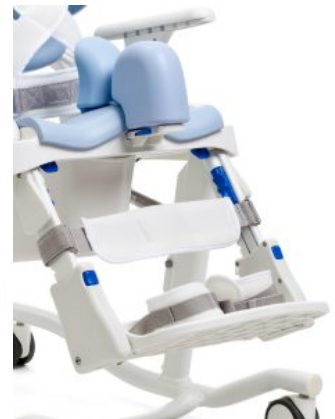
Soportes de pantorrilla HTS