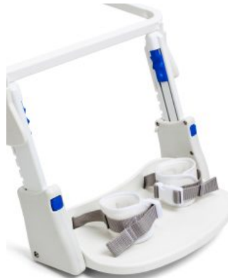
Cinchas de Tobillo HTS