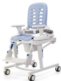
Base móvil HTS *Required