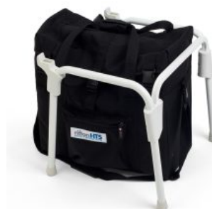
Base portátil con bolsa de transporte HTS