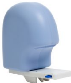
Taco abductor HTS