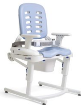
Base fija HTS *Required