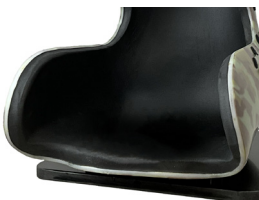
Base sin taco