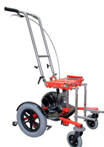
EDUCO 2 by Janton