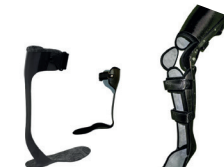
KAFO Y AFO