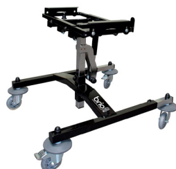
BRIO ECO by Janton