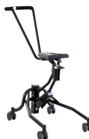
TALLY by Neatech