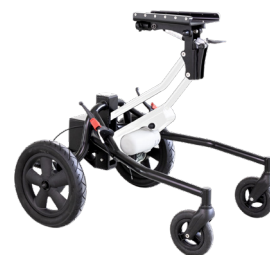
TALLY by Neatech