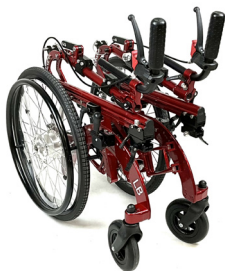
LB PLEGABLE by Neatech