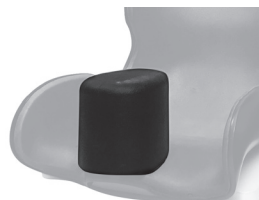
Base con taco estándar poliuretano fijo atornillado