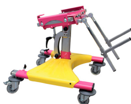
BRIO 2 by Janton