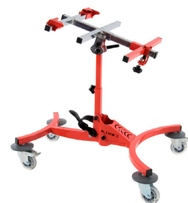
PLIMO 2 by Janton