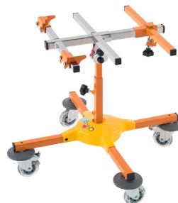
ECHO by Janton