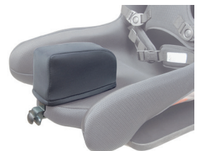
Base con taco a medida extraíble