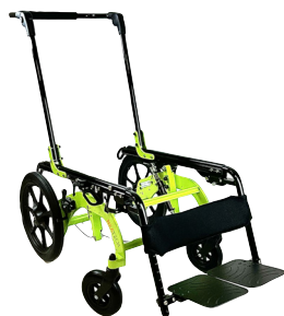
LB RÍGIDO by Neatech