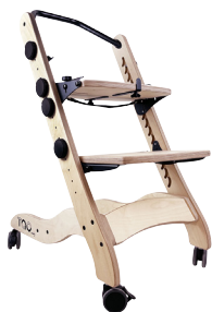
TAO by Janton