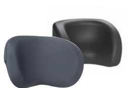
Reposacabezas a medida o estándar