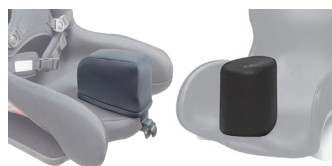
Taco abductor a medida extraíble o estándar fijo atornillado