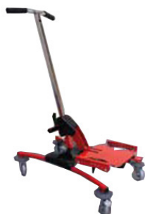
HISSÉO by Janton