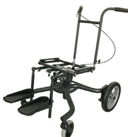
LAGO by Janton