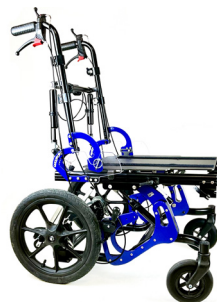
DYNA by Neatech