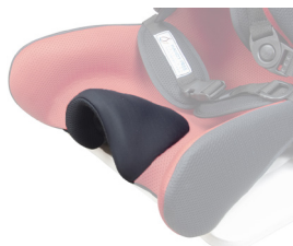
Base con forma taco termoformado incorporado